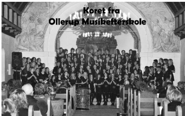
Flot koncert med 114 unge fra Ollerup Musikefterskole.