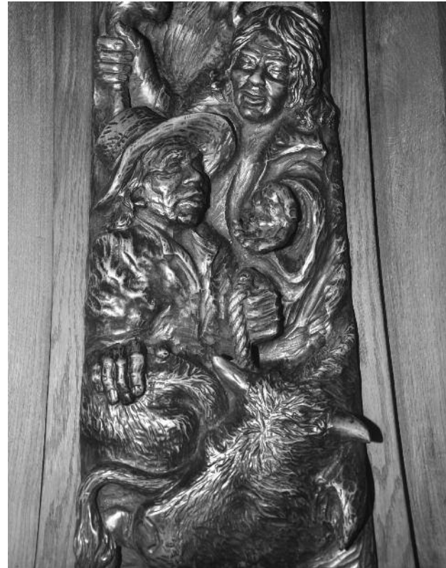
Prædikestolen i Nazarethkirken.

Men inden vi fordyber os lidt mere i det, så er det måske en idé, at vi opholder os lidt ved det noget ejendommelige faktum, at vi lever i en verden, hvor