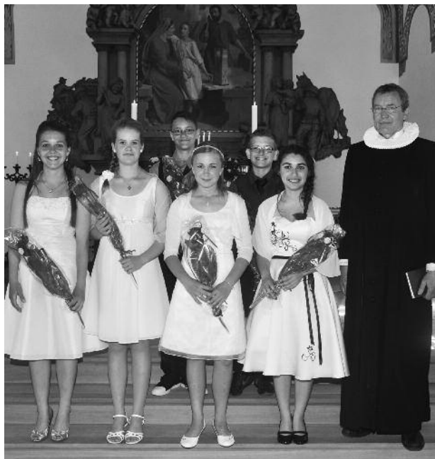
Konfirmation i Nazarethkirken søndag den 5. juni.

i bestyrelsen blev det besluttet, at vi i løbet af dette år skal bruge lidt tid på at drøfte den gudstjenesteform, vi har – og om der er nogle detaljer, der skal forandres?