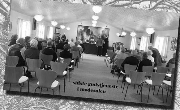
sidste gudstjeneste i mødesalen