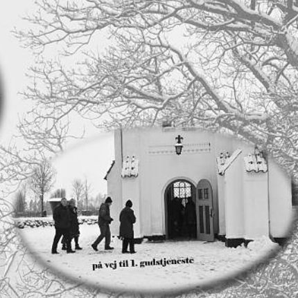
på vej til 1. gudstjeneste